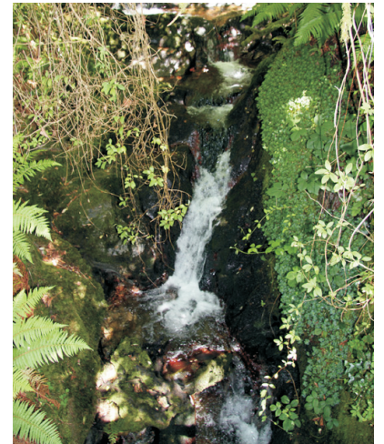
Outro pequeno salto no camiño da seimeira