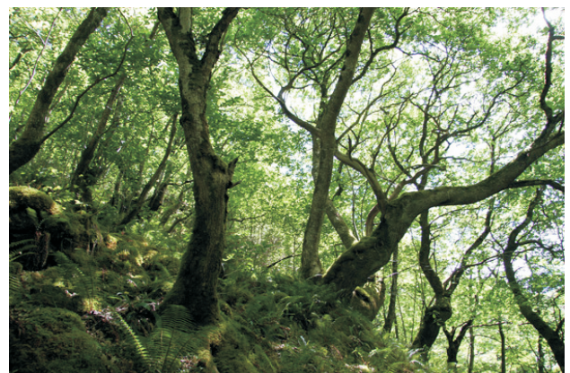
Fraga de Reigadas.