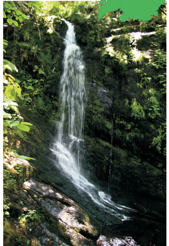
Seimeira da Chamosa